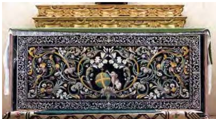
Abb. 2: Stipes-Verkleidung in Scagliola, Santo Stefano, Perugia/Umbrien

Der Dreißigjährige Krieg ist auch der Grund, weshalb sich die Baukunst des Barock in Deutschland in einer auffälligen zeitlichen Verschiebung im Vergleich zu anderen europäischen Ländern, wie z. B. Italien, entwickelte. 20 Erst gegen Ende des 17. Jahrhunderts verfügten die weltlichen und kirchlichen Auftraggeber wieder über ausreichende finanzielle Mittel für intensive Bautätigkeiten. 21