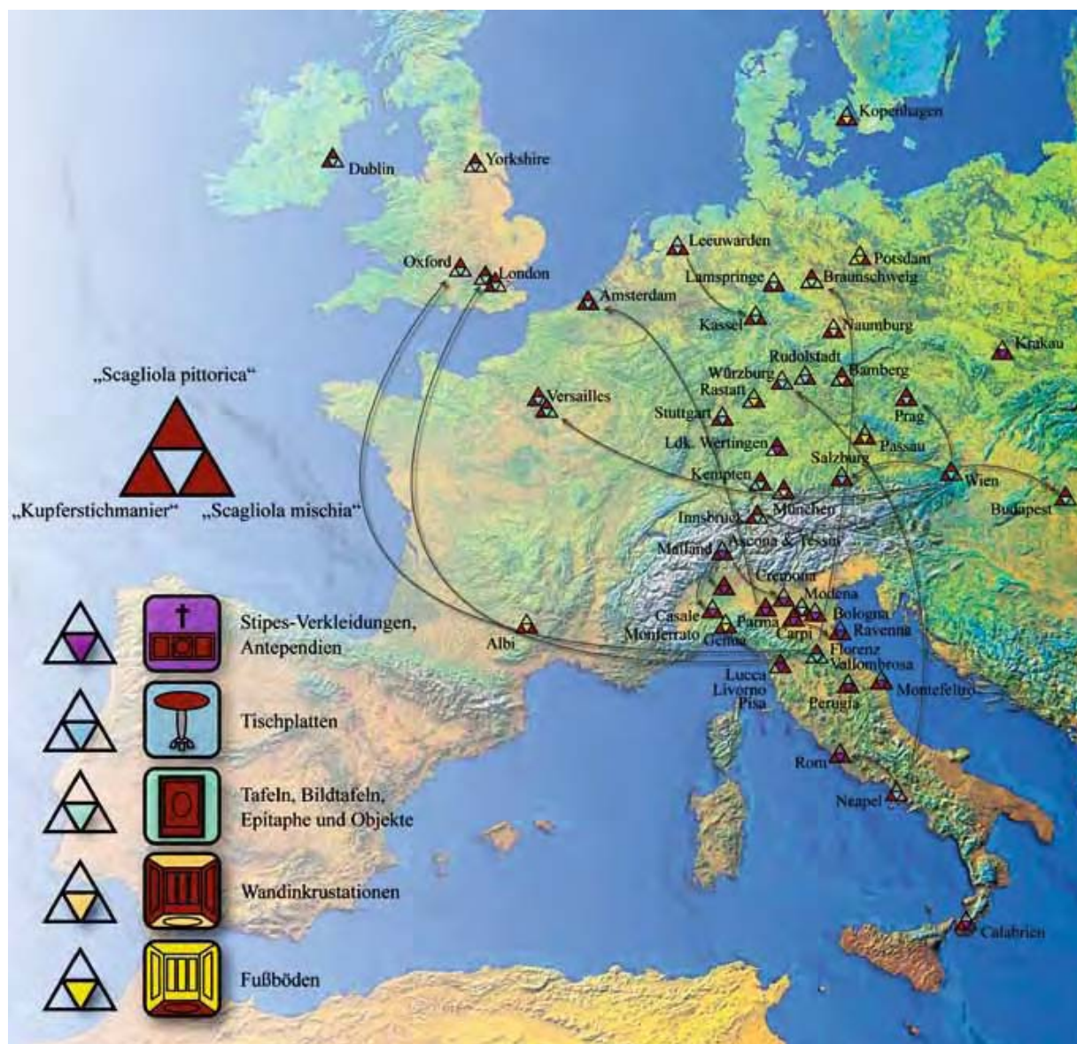
Abb. 5: Verbreitung von Scagliolaarbeiten in Europa

Silvia BOTTICELLI, Il fascino dell'illusione: Storia e tecniche dei manufatti in scagliola/The fascination of illusion: The history and technique of Scagliola , Florenz 2006.