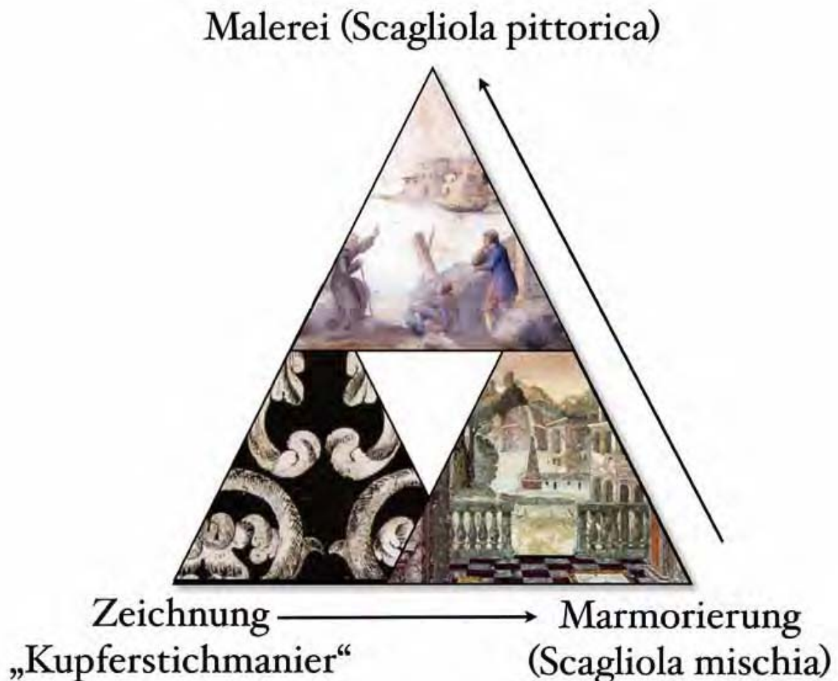
Abb. 3: Werkstile und Entwicklungslinie

Bei der Suche nach den Ursprüngen des Stuckmarmors und der Scagliola muss historisch und insbesondere auch materialtechnisch nach den Wurzeln von Stuck und Inkrustations- und Intarsienarbeit in Gips gesucht werden. Eine besondere Bedeutung kommt hierbei m. E. den frühmittelalterlichen Hochbrandgipsfußböden zu, die sowohl im deutschsprachigen Raum als auch im fränkischen Kulturraum weite Ver-