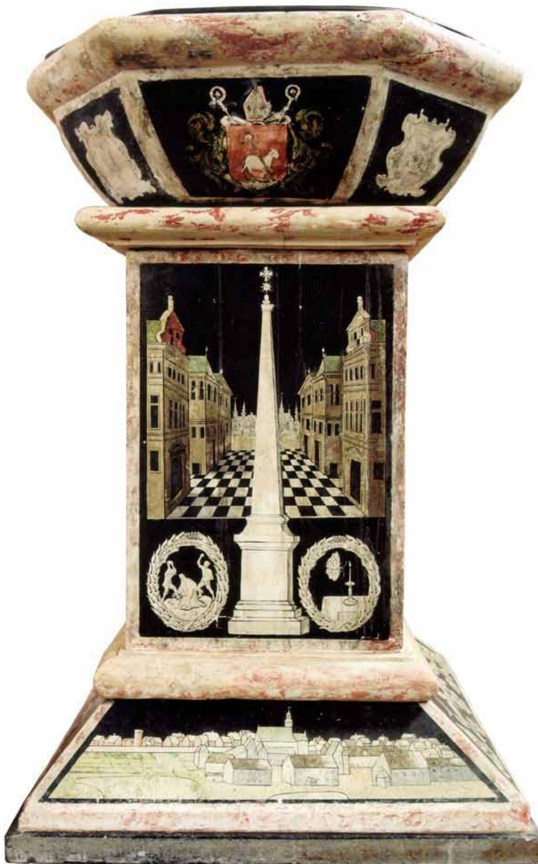
Abb. 1: Weihwasserbecken in der Stiftskirche in Lamspringe/Niedersachsen